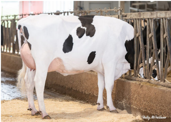
SANDY-VALLEY BORN2BOOGIE DAM